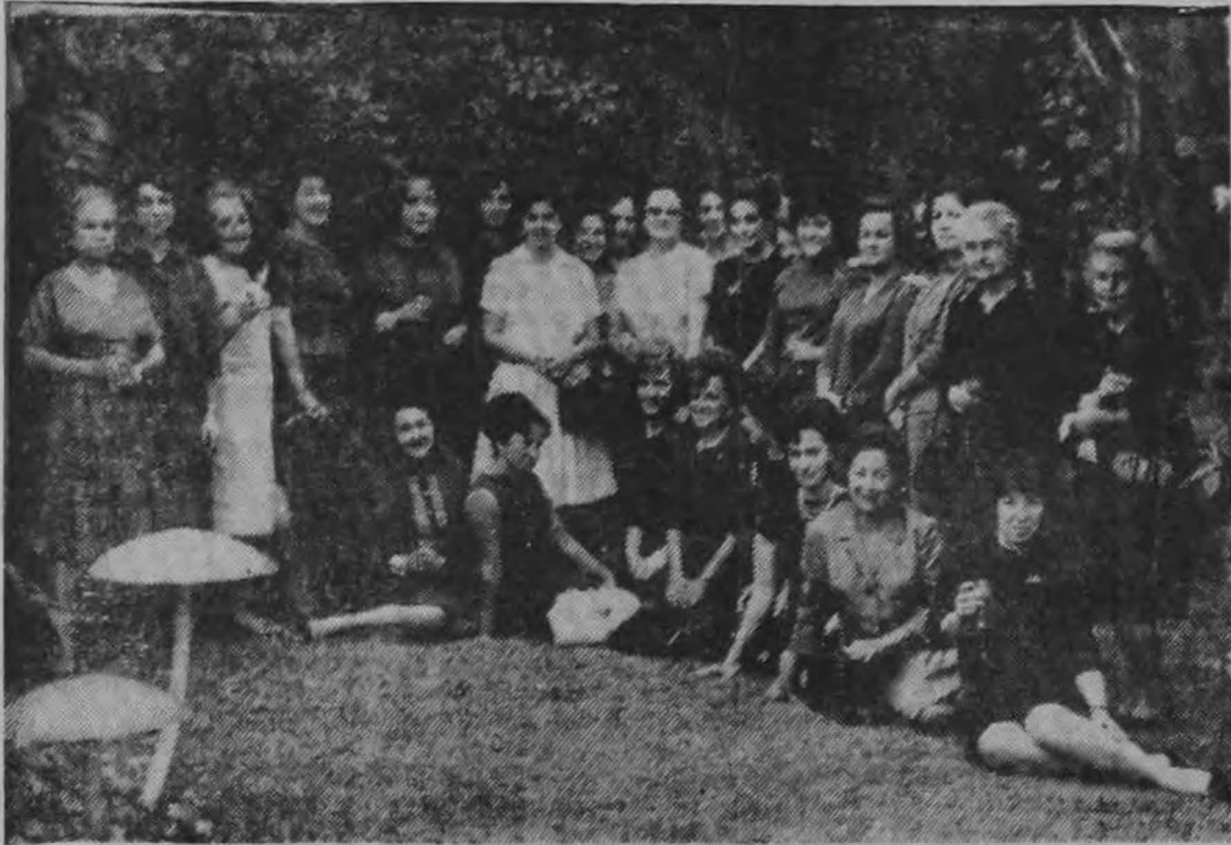
Un grupo de encantadoras señoras asistentes al agasajo.