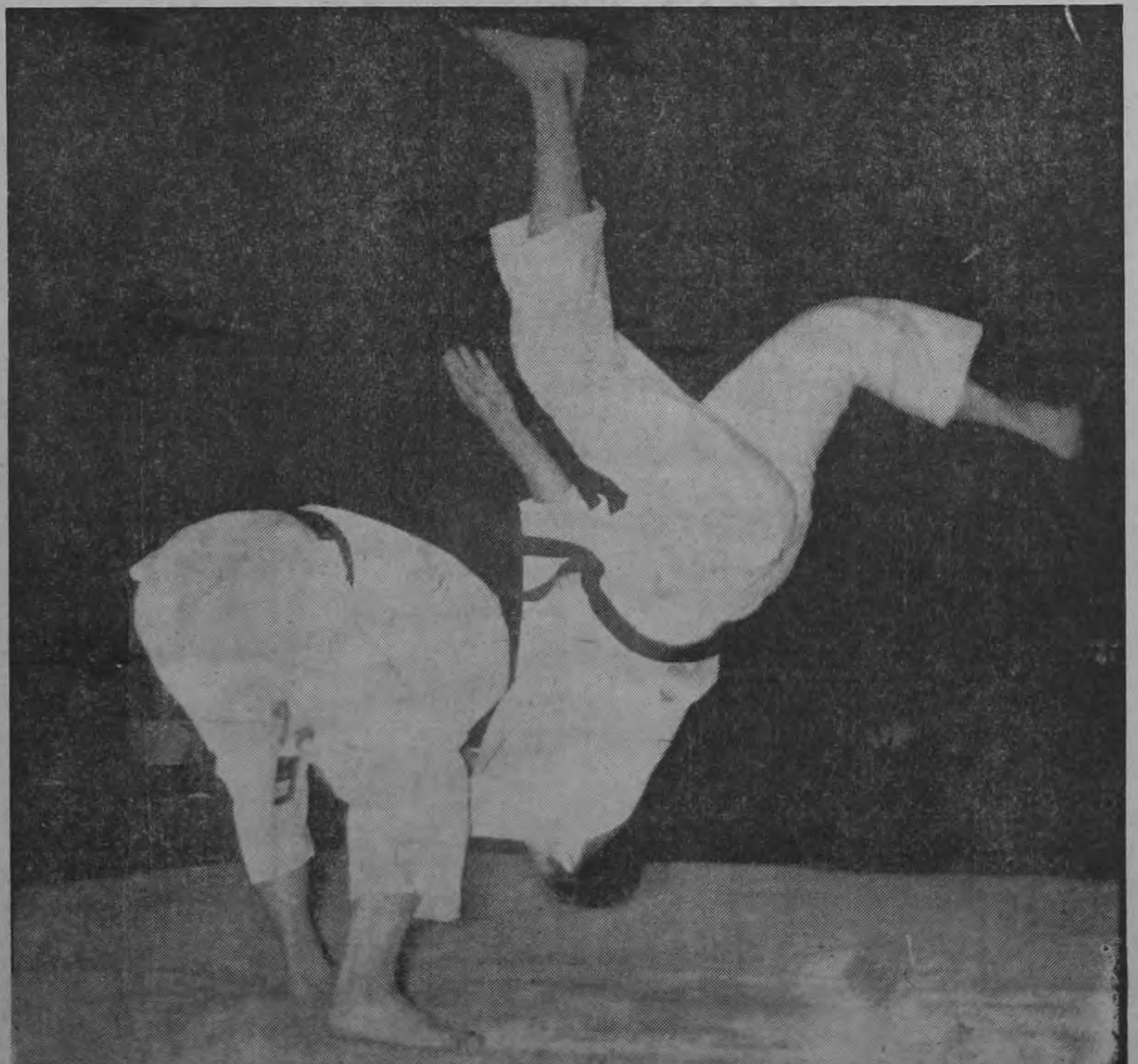
Espectacular fotografía captada por nuestro fotógrafo, cuando el maestro japonés Hayward Nishioka realizó una demostración de su versátil habilidad como judoka. Este "levantiu" constituye en dicho deporte todo un galardón, requiriendo mucha habilidad para lograrlo.