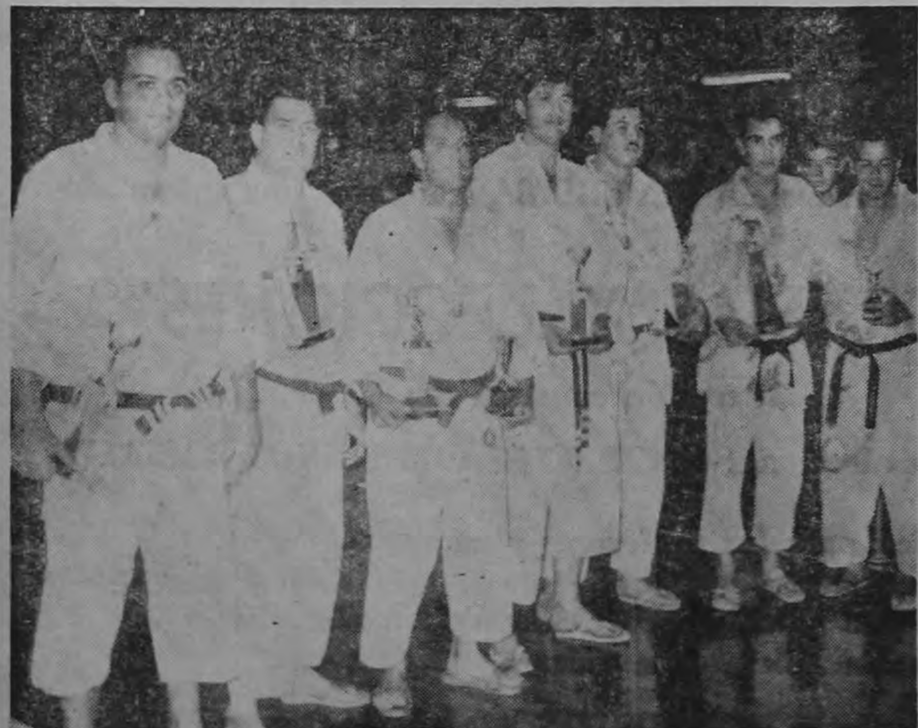
Este es el equipo de Costa Rica que clasificó Campeón Centroamericano de Judo, y que tan excelente papel cumpliera.